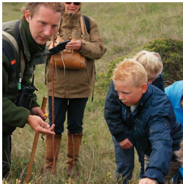
"Zoeken naar de bewoners van De Slufter" leuk voor iedereen.