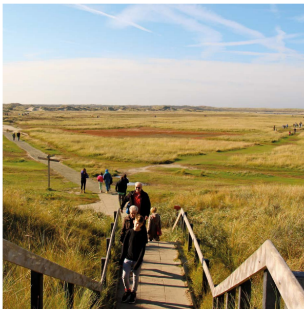
De meeste Texelgangers bezoeken De Slufter.

stuifdijken die het eiland met Texel verbonden kon een kwelder groeien. Deze is ingepolderd en op de oevers van de oude kreken ontstond fraaie natuur.