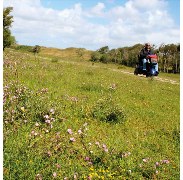
Langs het Slag door de Nederlanden bloeien veel bijzondere plantensoorten.

In De Mui broeden lepelaars, meeuwen, kiekendieven, aalscholvers, blauwborsten en nachtegalen. Ook de plantengroei is bijzonder rijk. In de duinweiden aan de oostkant van De Mui groeien verschillende soorten orchideeën.