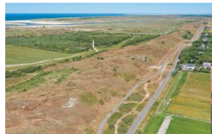
De Zanddijk is veranderd in een hoog duin

Het is een wijdverbreid misverstand dat de Hoge Berg met zijn 15 meter boven NAP het hoogste punt van Texel is. De duinen tussen De Koog en Den Hoorn zijn veel hoger, met de Seetingsnol als hoogste punt, zo'n 25 meter boven NAP. Een wandeling vanaf Ecomare voert ernaartoe.