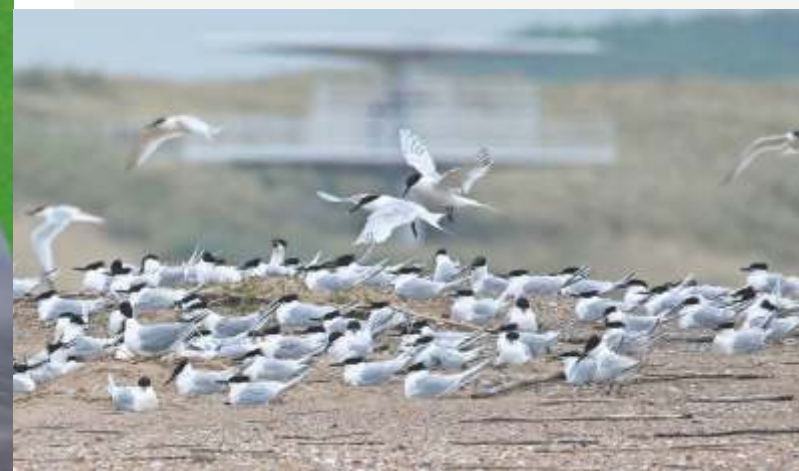
KOLONIE GROTE STERNS OP DE PRINS HENDRIKZANDDIJK

Als oplossing denkt de onderzoeker aan het vaccineren van grote sterns. 'Er zijn succesvolle proeven uitgevoerd met de vaccinatie van kippen en eenden, maar het is niet gegarandeerd dat dit vaccin ook geschikt is voor grote sterns. Hopelijk mogen we dit jaar van het ministerie van LNV een theoretische studie doen en daarna een praktijkproef. Als die positief uitpakt, zouden we over twee jaar kunnen vaccineren.'