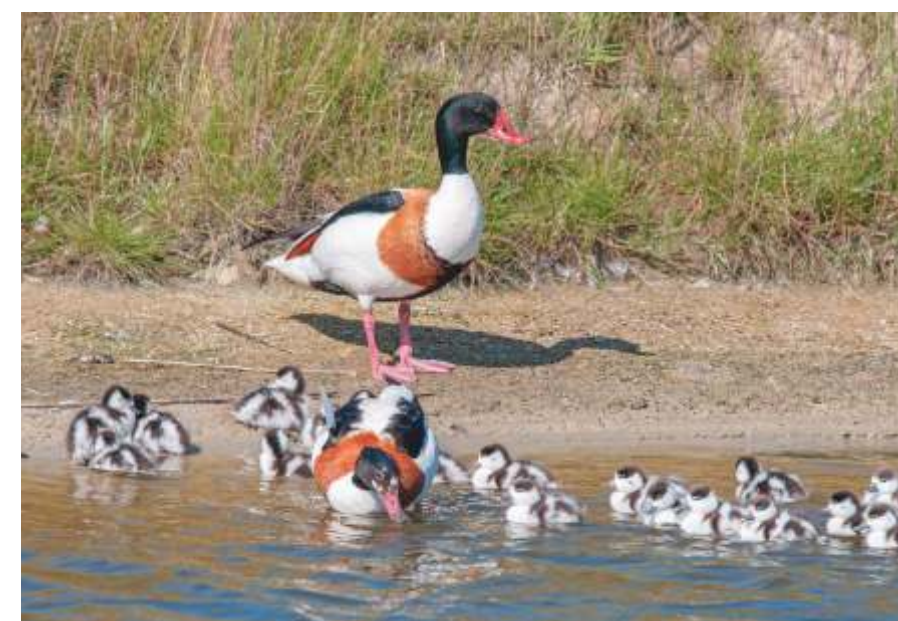
ALLE PULLETJES VAN DE BERGEENDEN GAAN HET WATER OP, MET ESCORT VAN ENKELE VOLWASSEN DIEREN

Een andere vogel die het wel makkelijk vindt om het verlaten huis van een ander dier te benutten, is de bergeend. Deze kustbewoner broedt ook graag zijn eieren uit in een konijnenhol. Als dat niet voorhanden is, gebruikt hij ook wel holle ruimtes onder aanspoelsels op het strand of verstopt hij z'n eieren tussen dichte begroeiing. Het legsel van een bergeend bestaat uit zo'n acht tot tien eieren, die na 28 dagen uitkomen. De jongen gaan naar de crèche, waar ze onder toezicht van volwassen bergeenden gezamenlijk rondzwemmen in een duinmeer of waterplas. De bergeend is met zijn felrode snavel en bontgekleurde schakeringen op een wit verenkleed een opvallende vogel. De mannetjes onderscheiden zich van de vrouwtjes door een knobbel op de snavel. Als echte kustbewoners voeden ze zich met (week)dierpjes uit zachte slikbodems.