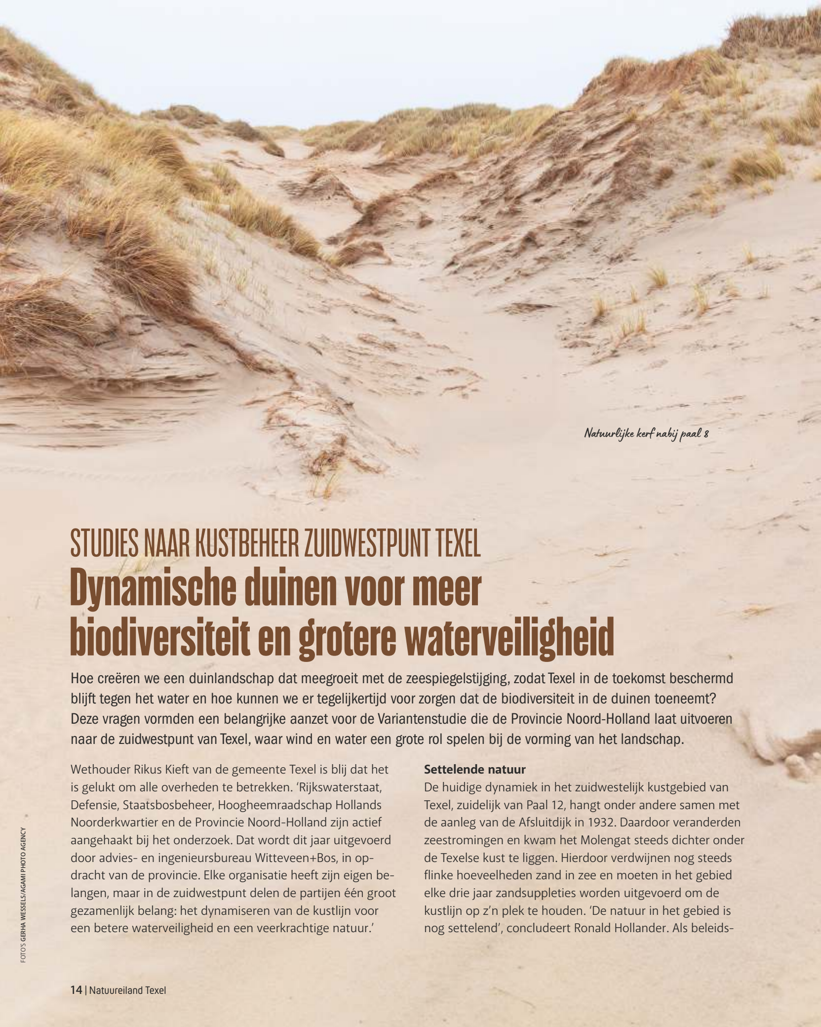
Natuurlijke kerf nabij paal 8