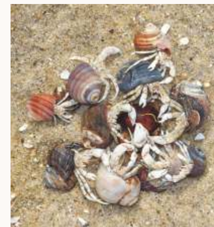
HEREMIETKREEFTJES STRIJDEND OM EEN SCHELP

Als het heremietkreeftje groeit, zoekt het een groter schelpje. Grappig is dat de diertjes aan woningruil doen. Als er één in een vrij grote schelp trekt, verhuist een iets kleinere soortgenoot snel naar de schelp die hij achterlaat en zo gaat het een tijdje door.