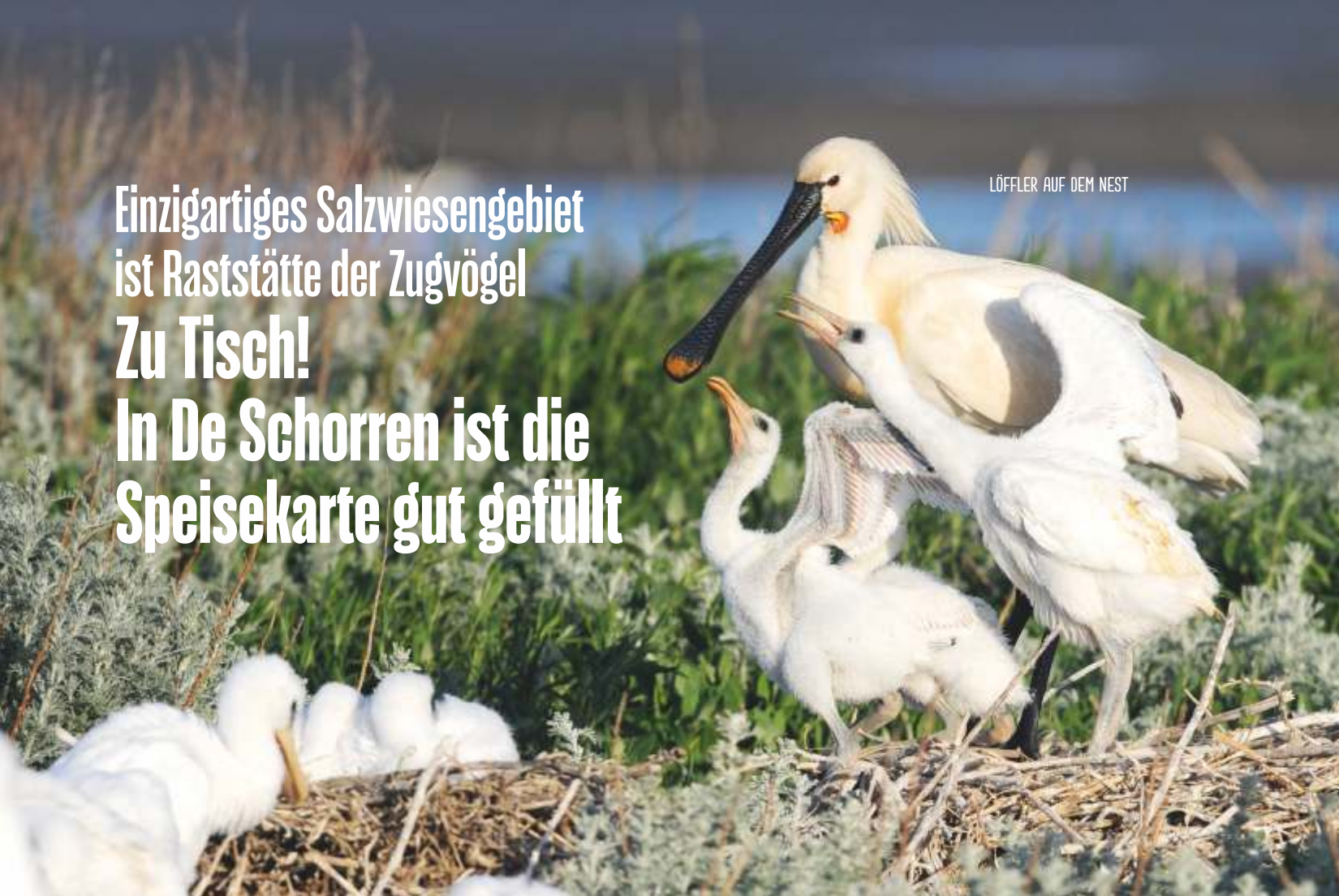
LÖFFLER AUF DEM NEST

Schnell eine Garnele aufpicken oder einen fetten Wattwurm verschlingen. Oder vielleicht doch ein anderes schmackhaftes Meerestierchen? Für unzählige Vögel ist das Naturgebiet De Schorren ein ganzjährig geöffnetes Restaurant mit einer attraktiven Speisekarte. Zehntausende von See- und Wattvögeln nutzen das Gebiet zum Rasten, zur Nahrungssuche und zum Brüten, und noch einmal Hunderttausende machen hier während des Vogelzugs einen Zwischenstopp, um aufzutanken.