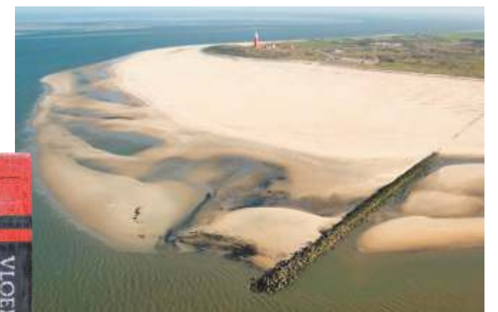
De Eierlandse dam hield al snel zand vast