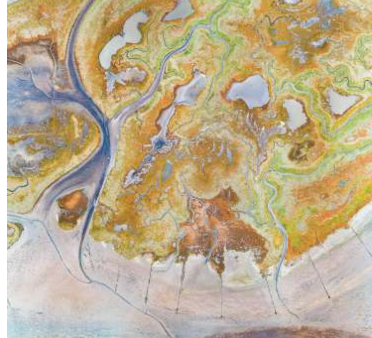
AUS DER LUFT IST DAS PRIELSYSTEM VON DE SCHORREN GUT ZU SEHEN

In der Brutzeit von März bis August können Sie auf De Schorren große Kolonien von Brutvögeln beobachten.