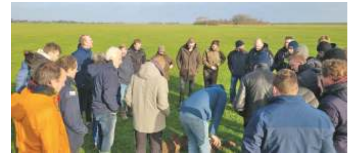
NA AFLOOP VAN DE THEORETISCHE BODEMCURSUS BEKIJKEN DEELNEMERS HET RIJKE BODEMLEVEN VAN EEN GRASPERCEEL IN EEN PROFIELKUIL.

Het is de bedoeling dat stichting Wij.land zich uiteindelijk terugtrekt en de lokale partijen samen verdergaan met Lerend Netwerk Texel. In de visie van Wij.land moet die