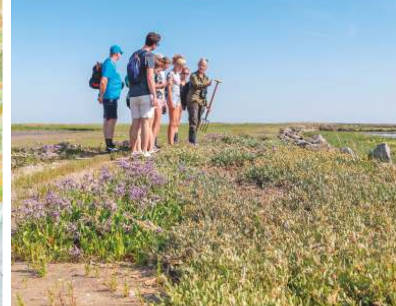
MIT DEM FÖRSTER IN DAS GESPERRTE GEBIET

Im Wattenmeer bestimmen die Gezeiten den Lebensrhythmus. Bei Niedrigwasser bietet sich die Gelegenheit, auf den trocken liegenden Wattflächen nach Nahrung zu suchen. Wenn die Priele bei Flut wieder voll strömen, ist es Zeit, sich auf den höher gelegenen trockenen Bereichen auszuruhen. Um das Gebiet zu schützen, hat der Eigentümer Natuurmonumenten im Jahr 1978 Buhnen angelegt. Dadurch wurde verhindert, dass die Ufer weiter erodierten und die