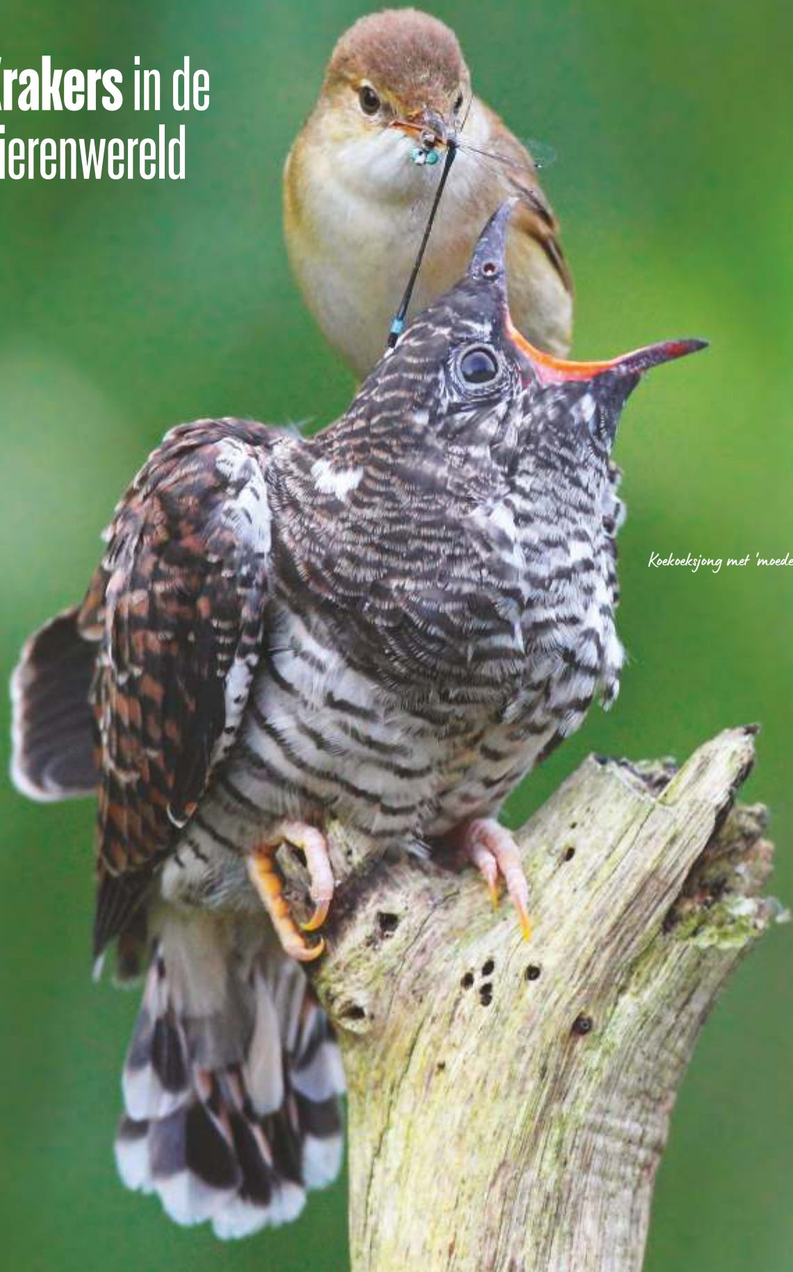
Koekoeksjong met 'moeder' bosrietzanger

Het valt niet mee om op Texel een woning te vinden. De dierenwereld heeft daar een oplossing voor gevonden: kraken!